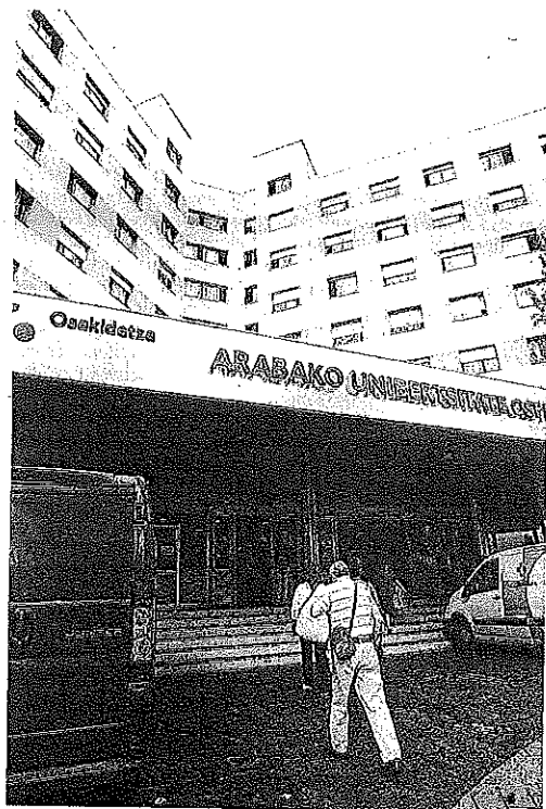
Acceso principal al HUA-Txagorritxu.

Por ello, anunciaron también que han solicitado un nuevo encuentro con la dirección de Osakidetza y que a la vuelta del verano no descartan movilizaciones para terminar con "el calvario" que están sufriendo las trabajadoras del servicio de limpieza de las contratadas en la OSI de Álava. — Eje