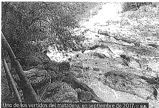
Uno de los vertidos del matadero, en septiembre de 2017. de N.B.