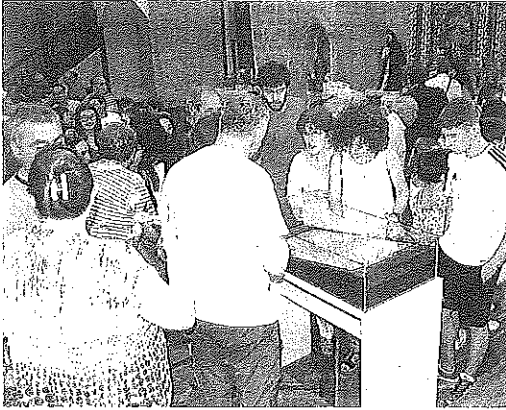
Mirando el documento expuesto ayer en Labraza.

Desapareció del pueblo y reapareció en una casa de subastas de Madrid