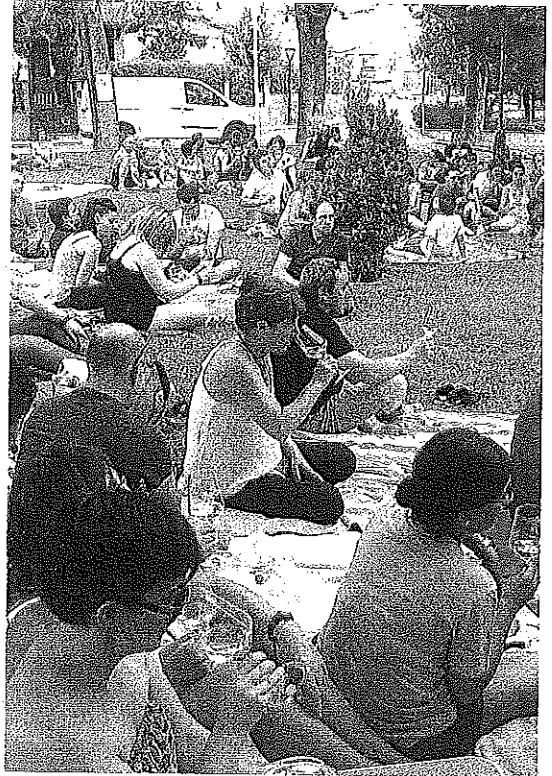
La cata 'Wine&Music' se celebrará el jueves.

A partir del jueves, la agenda gana en intensidad con una cata maridaje de vino y chocolate y la celebración del 'Wine&Music' el viernes. El momento más esperado es el del concierto del sábado, a las 20.00 horas en la plaza Mayor, de Iñaki Salvador Trio, dentro de las IV Jornada