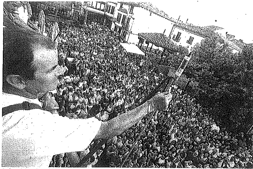
Oyón celebrará sus fiestas de Acción de Gracias entre el 21 y el 26 de agosto.