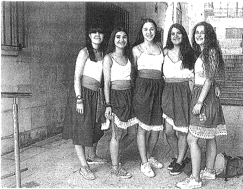
Cinco neskas posan en el pasadizo situado debajo de la plaza.