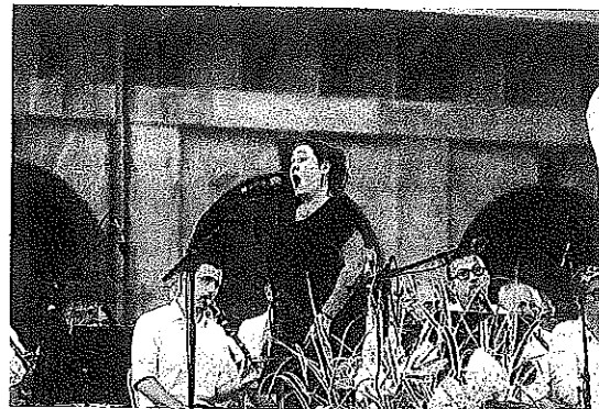
La soprano Haizea Muñoz durante una actuación.