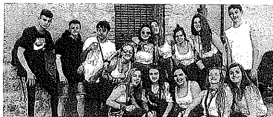
Una cuadrilla de jóvenes, ayer.

Desde allí, a un tiro de piedra, en la plaza de San Vicente, una larga sirga, que une la torre de la iglesia parroquial con la terraza superior del edificio que conserva el escudo heráldico de los Palacios, situado a más de cien metros de distancia, sirvió para