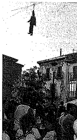
Ambiente en la bajada del Katxi.

POR LA TARDE, MÁS Para la tarde se ofrecerá a los txikis un parque infantil con juguetes, triciclos, toboganes y paseos en el tren racimo y a las 19.00 horas será el primer encierro de reses bravas. Tras ello se celebrará una nueva degustación, en este caso de queso con membrillo, a cargo de la Asociación club vehículos clásicos Rioja Alavesa Classic y para dar paso a las verbenas se ballará la danza de la Era. La orquesta de esta noche será Ingenio y en el intermedio no faltará el consabido toro de fuego. A las 22.15 horas se quemará una colección de fuegos artificiales. ●