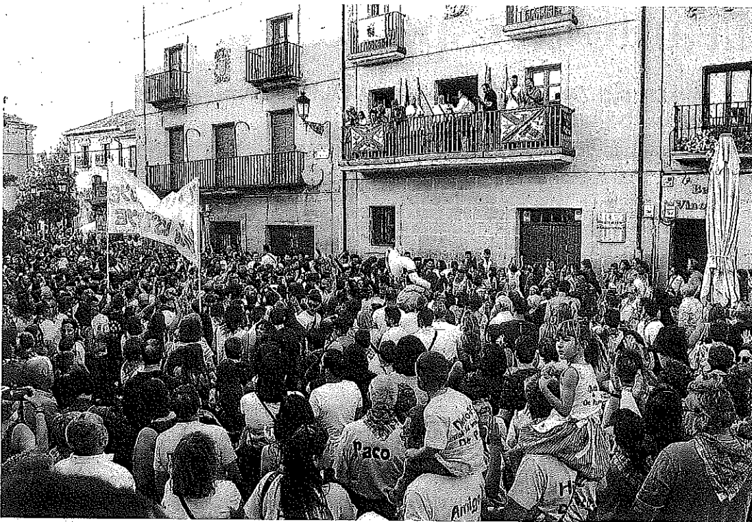
Tras el txupinazo, hoy se celebra el día grande con misa y pasacalles.