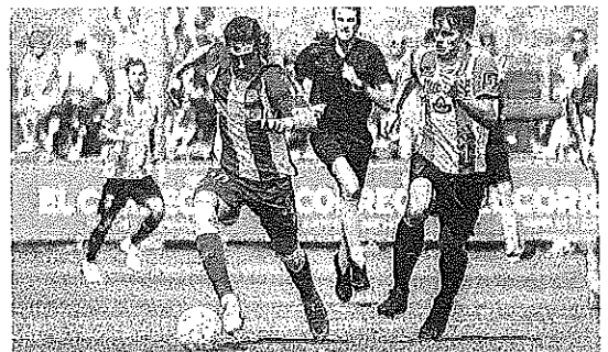
Imagen del partido de Ibaia ante el Logroñés.