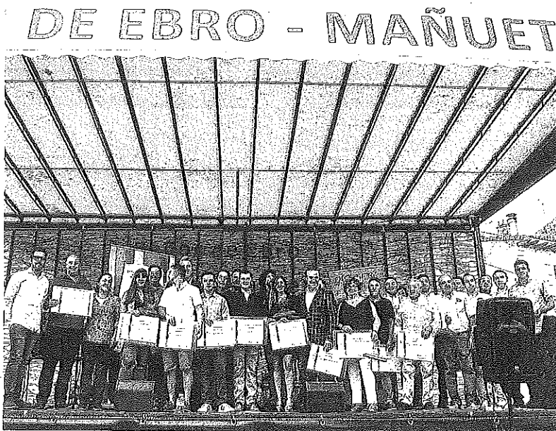
Entrega de premios ayer en Baños de Ebro del concurso de la vendimia.