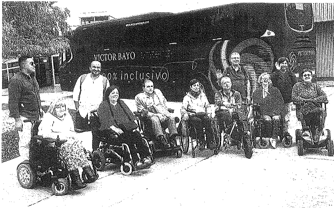
Parte de los turistas, llegados desde Madrid, posa para la fotografía.