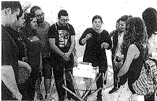
GYNCANA EN EL EUROPA. La celebración del 30 aniversario del Palacio Europa llegó ayer al edificio de la Avenida de Gasteiz de Vitoria con una sala de escape en la que decenas de ciudadanos participaron en grupos en una gyncana de juegos de lógica, como se ve en la foto. También hay, de mano del Ayuntamiento, visitas guiadas al palacio todos los viernes hasta finales de octubre.