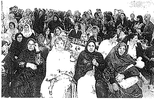
ABIERTA LA CASA DE LAS MUJERES. Decenas de mujeres celebraron ayer, juntas, en el palacio Etxanobe la apertura de Emakumeen Etxea. Un espacio que "es de todas, y queremos compartir y conocernos. Queremos hacer de Sorginenea tu casa feminista, un lugar de empoderamiento de las mujeres", manifiestan las impulsoras.