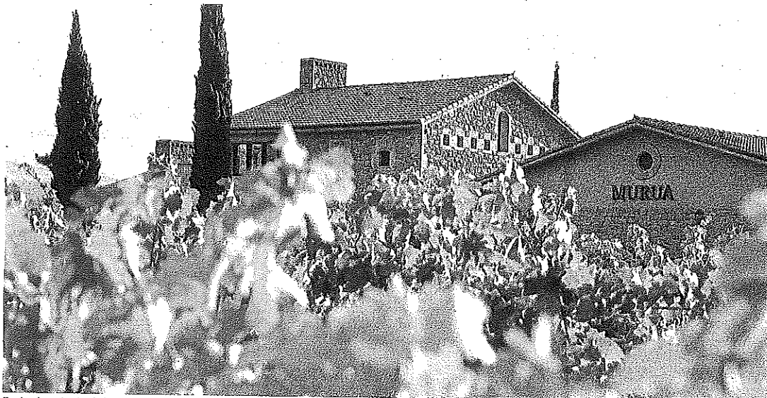
Fachada principal de Bodegas Murua, junto al viñedo que rodea la finca.