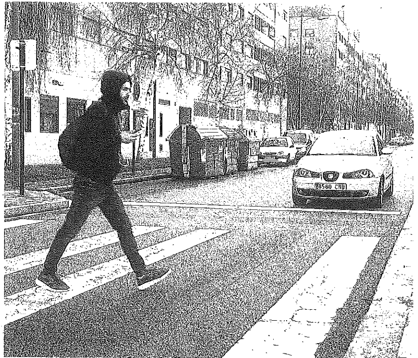
Un peatón atraviesa un paso de cebra en la amplia Avenida Reina Sofia.