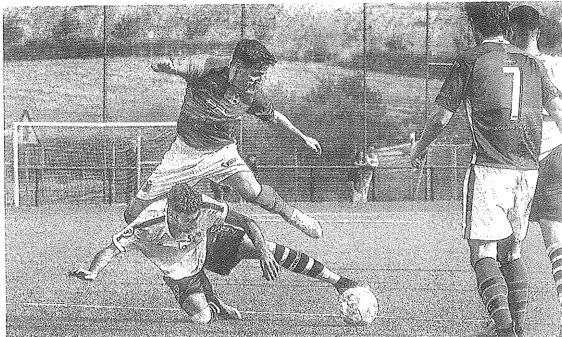
Un jugador del Sodupe salta por encima de un futbolista colegial, caído en el césped.

El Ariznabarra, que sigue estancado tras sumar solo un punto de los últimos doce en juego, precisa reaccionar hoy ante un rival directo, el Somorrostro (Olarande, 12:00 horas). El cuadro celeste se conjura para revertir la situación y puede salir del descenso si es capaz de reencontrarse con el triunfo contra los vizcaínos.