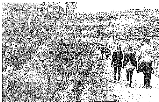
Elciego celebra el noveno paseo 'Entre Viñas'.

El Ayuntamiento de Elciego es el primero en poner en marcha el fin de semana con la celebración el sábado del noveno paseo 'Entre Viñas'. La plaza Mayor de la localidad será el punto de partida, a las 11.00 horas, de un evento consolidado y que propone un sencillo recorrido,