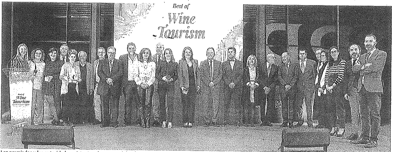
Los premiados y las autoridades asistentes al evento celebrado en Bodegas Baigorri posan a su finalización.