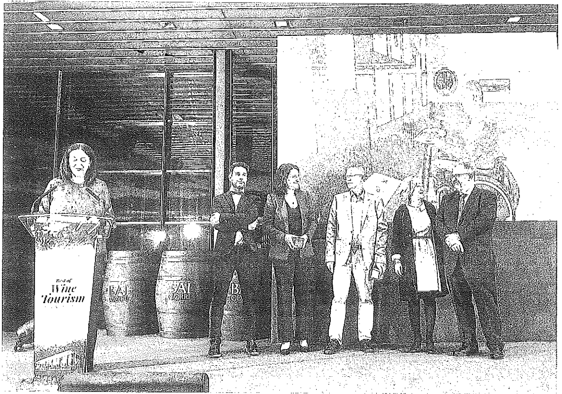
La entrega de premios se celebró ayer en Samaniego.

Los premios Best of los convoca la red de mundial de capitales y grandes viñedos, de la que forman parte las cámaras de comercio vascas y riojana, el Consejo Regulador del Denominación de Origen Calificada Rioja y el Ayuntamiento de Bilbao. Y están abiertos a las bodegas de la denominación y empresas del sector de Álava, Bizkaia y La Rioja. ●