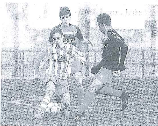
Un jugador de la Oyonesa intenta recortar a su defensor.