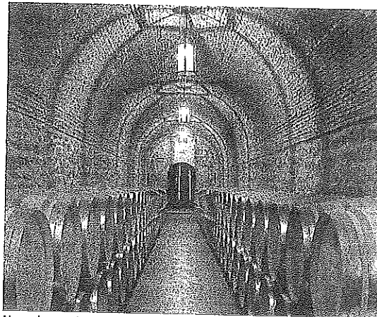
Nave de envejecimiento de Bodegas Riojanas. L.R.

La histórica marca de la centenario Bodegas Riojanas es una de las más reconocidas de Rioja en las categorías de reserva y gran reserva, que representan el estilo de vinos con gran potencial de envejecimiento que ha cimentado el prestigio de la región y que, como es el caso de Monte Real, han experimentado una evolución enológica muy significativa hacia un perfil más innovador para acercarse a las tendencias del mercado, informa la compañía.