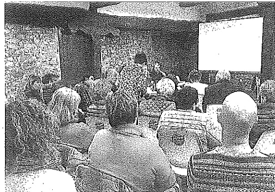
Asamblea de Areta celebrada el pasado mes de febrero.