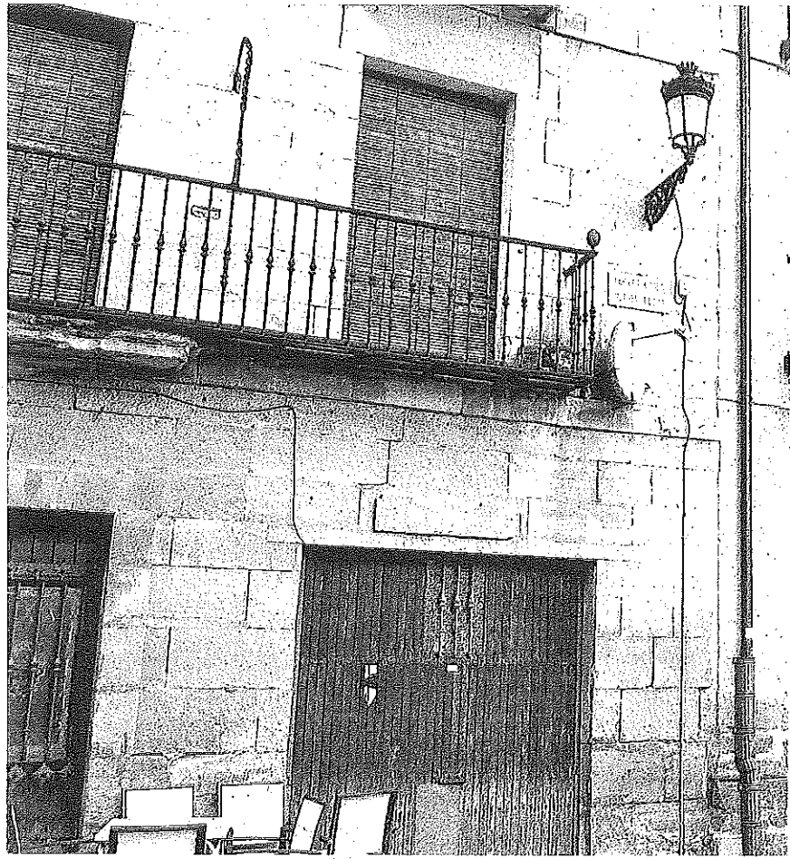
Fachada del Ayuntamiento de Oion.