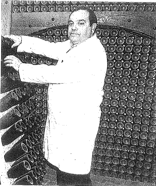
Un empleado de Bodegas Faustino procede al metódico proceso de giro de las botellas del cava que elaboran.

buscar una salida a la cantidad de blanco que tenían almacenado.