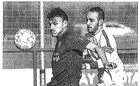
San Ignacio y Balmaseda no pasaron del empate en Ibaia.

La segunda parte se mantuvo con el mismo dibujo. El peligro solo llegaba en jugadas a balón parado que