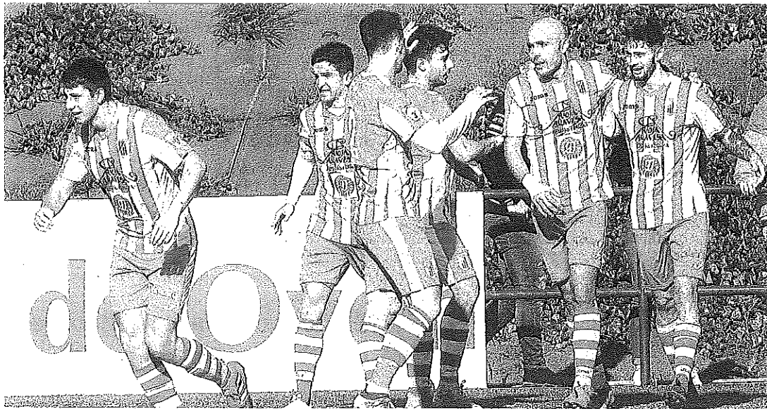
Los jugadores de la Oyonesa celebran uno de sus tres goles al Arnedo.