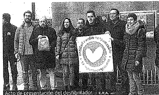
Acto de presentación del desfibrilador.

El S.M. El Ayuntamiento de Laguardia ha instalado un desfibrilador de última generación en la calle, junto a la oficina de la Policía municipal y el viejo frontón. Una herramienta que puede salvar vidas y en cuyo uso, así como en primeros auxilios y reanimación, el Consistorio formará a su personal.