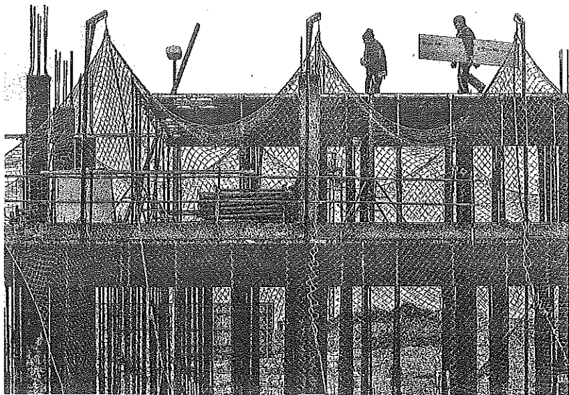
La construcción tiene registrados 1.133 parados en Álava según Lanbide, 153 menos que hace un año. :: e. c.

Por municipios en Bizkaia, el municipio que arroja una peor estadística es Sestao, con una tasa del 17,7%, que afecta sobre todo a las mujeres. Los porcentajes más bajos, inferiores al 4%, afloran en municipios muy pequeños como Orozko, Bolibar y Meñaka.