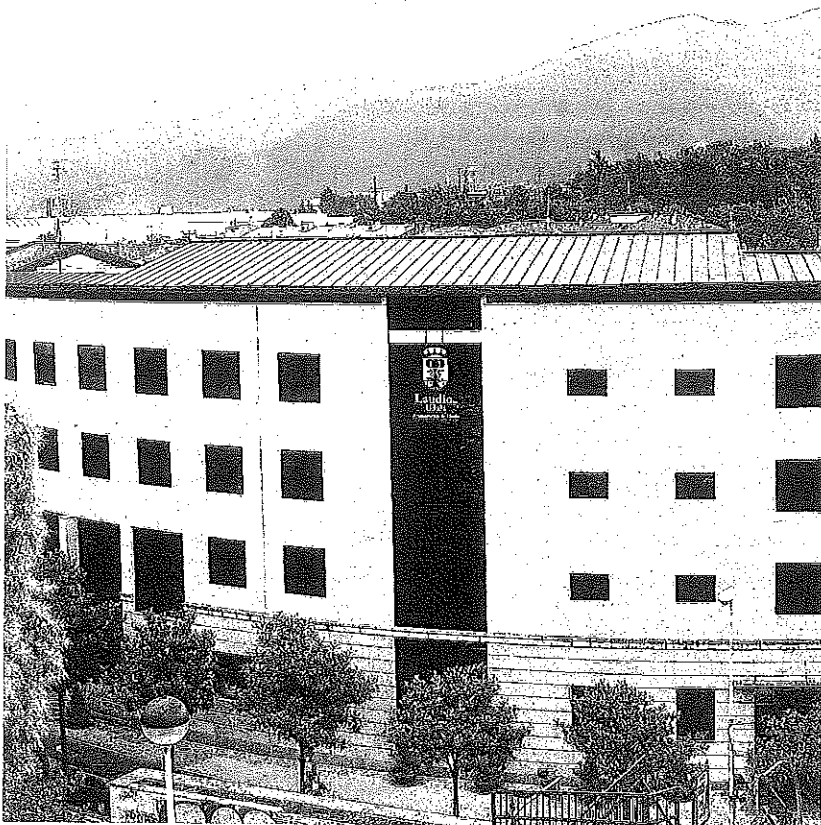
Exterior del Ayuntamiento de Llodio, que acometerá las mejoras.