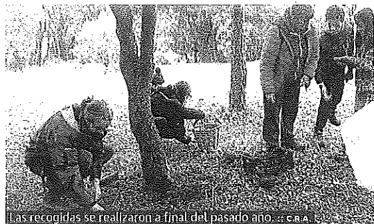
Las recolecciones se realizaron a final del pasado año.

El S.M. La iniciativa 'Gran bellotada de Rioja Alavesa' cumple este sábado sus últimos plazos, y es que después de la recolección llega la siembra de bellotas. En Lapuebla de Labarca se realizará a partir de las nueve de la mañana, mientras que en Labastida también será a partir de las 10.30 horas.