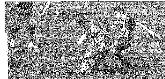
Los blanquiazules fueron superiores al colista.