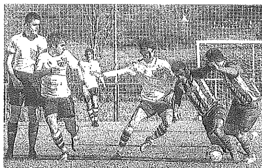
Un jugador visitante aguanta la presión vitoriana. ■ JESÚS ARRABADA

Ayer parecía un día propicio para reencontrarse con las victorias ante una Cultural de Durango en situación delicada, pero, de nuevo, la suerte le dio la espalda al conjunto vitoriano. El choque fue intenso con dos equipos que querían dominar el jue-