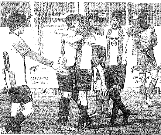
Los jugadores de la UDL celebran uno de sus goles.

Y de goles iba el partido. El primero llegó en el minuto tres. Casi sin darse cuenta, Pozo había marcado el primero de un resultado que les llevaría a la victoria. Unos minutos más tarde, Izan remataba el se-