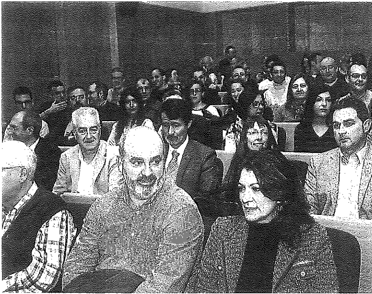
Jendea Arabako Kalkulugunearen 50. urteurrenaren ospakizuneari.