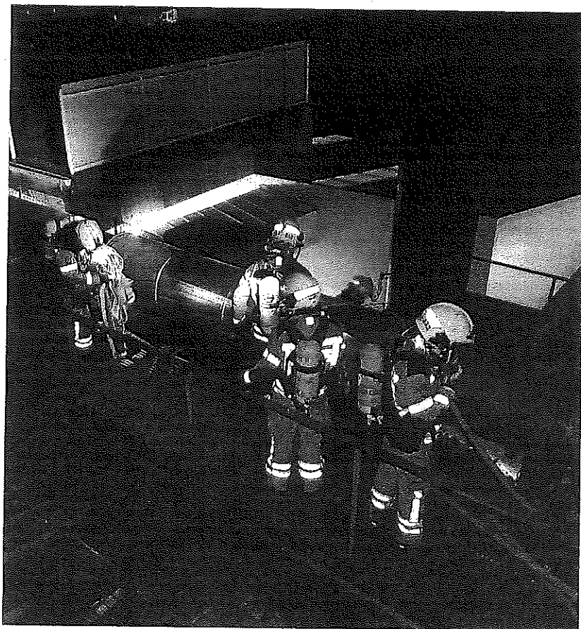
empresa Litalisa de Oion.