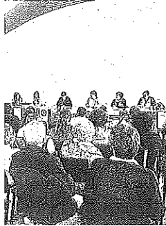
Acto de la escuela de igualdad.

LAGUARDIA - Laia eskola se consolida en todo el territorio como una referencia para la construcción de una sociedad sin desigualdades por razón de género. Por ello, además de actividades puntuales en Álava, impulsa procesos más largos que permiten compartir conocimientos y experiencias para profundizar en el objetivo del empoderamiento individual y colectivo. Estos procesos se basan en diferentes métodos, técnicas y herramientas, desde los clubes de lectura feminista mensuales, tanto en euskera como en castellano, hasta la utilización del teatro, la danza o el coaching.