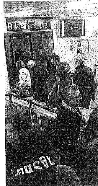
Un grupo de pasajeros en la terminal.

Los vuelos estarán operados por Air Nostrum, y el avión partirá de Foronda los miércoles a las 12.50 horas y aterrizará en Yerba a las 14.20 horas. En los viajes de regreso, la aeronave despegará de la isla tunecina a las 8.40 horas y tomará tierra en Vitoria a las 12.10 horas. En