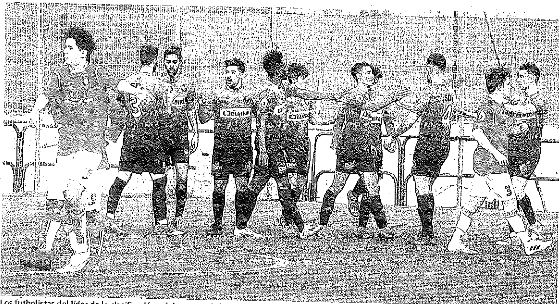
Los futbolistas del líder de la clasificación celebran uno de los seis goles que la SDL hizo en la tarde de ayer al colista Villegas. JUAN MARÍN