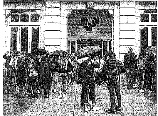
Estudiantes en el campus alavés de la UPV/EHU.

Todo estaba preparado, pero los cambios en la movilidad a causa de la expansión de la epidemia hicieron que se fueran buscando soluciones sobre la marcha. "Con todo el tribunal confirmado y sus estancias cerradas, una semana antes de la defensa se "cayó" la primera (una profesora francesa cuando el Gobierno francés la invitó a no viajar a Vitoria). Luego, día tras día, fueron informando las demás sobre su ausencia, por lo que recibimos autorización para hacerlo por vía telemática (salvo para el caso del miembro del tribunal que