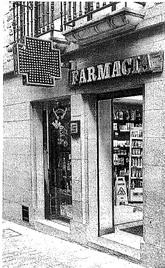
Entrada a la farmacia de la localidad de Laguardia.

Por esa razón la gente buscaba lugares donde informarse. Y esos lugares no eran ni el ayuntamiento ni el centro de salud, al que solo se podía acceder tras completar el pro-