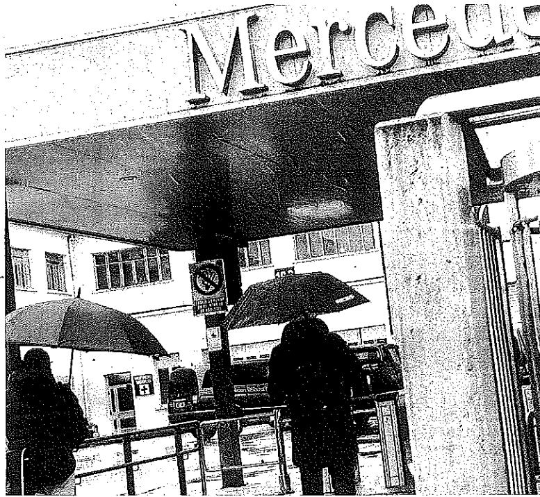
Trabajadores de Mercedes acceden a la planta gasteiztarra.

Por zonas de salud, la de San Martín es la que más nuevos contagios ha notificado en la última jornada (dos más), mientras que los ambulatorios de Gazabilde-Txagorritxu, Lakubizkarra, Iruña Oka, Olagübel y Sansomendi solamente tuvieron uno más cada uno de ellos. Y en el caso del Casco Viejo de Vitoria, Llanada Alavesa y Zuazo siguen con los cero casos de la víspera. ●