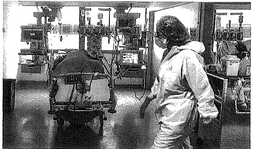
El Sistema de Salud ofrece en este año 7.515 plazas MIR, 362 de ellas de médico residente en Euskadi.