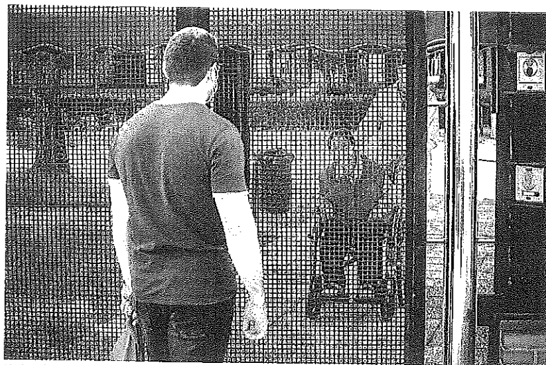
Un hombre visita a un familiar bajo una carpa instalada en la residencia Ajuria de Vitoria.

En las plantas ayer ocupaban una cama 277 enfermos con coronavirus. Son 8 más que el día anterior. No es raro que suba su número en fin de semana, ya que los sábados y domingos la cifra de altas a estos pacientes suele ser reducido. Parte de estos nuevos ingresos corresponden a personas que superaron la Covid-19 y han vuelto a ser hospitalizadas. En algunos casos por las secuelas que les ha dejado la enfermedad. En otros, porque se trata de ancianos con una salud muy deteriorada.