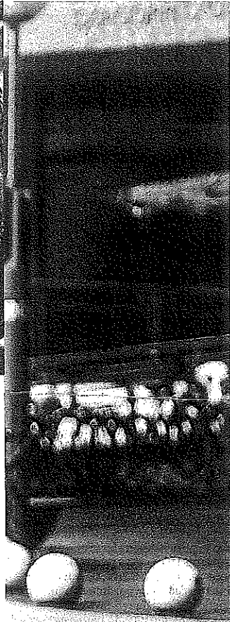
Acceso principal al HUA-Txagorritxu, uno de los puntos calientes de la pandemia, en la mañana de ayer.

cia de las posibles secuelas o enfermedades secundarias que deje la pandemia, lo que según Satse 'repercutiría también en mejorar los tratamientos contra esta patología'.