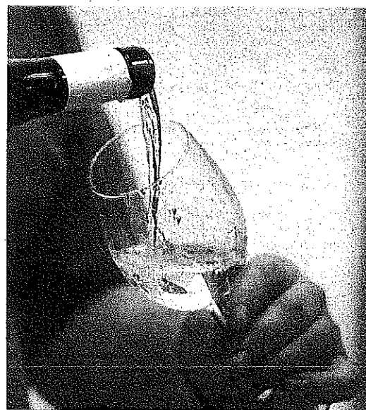
Un camarero sirviendo un vino en Ardoaraba.

Es el adelanto de entre 10 y 15 días que se espera respecto a lo habitual en Rioja Alavesa. No obstante, habrá que ver cómo se desarrolla el verano.