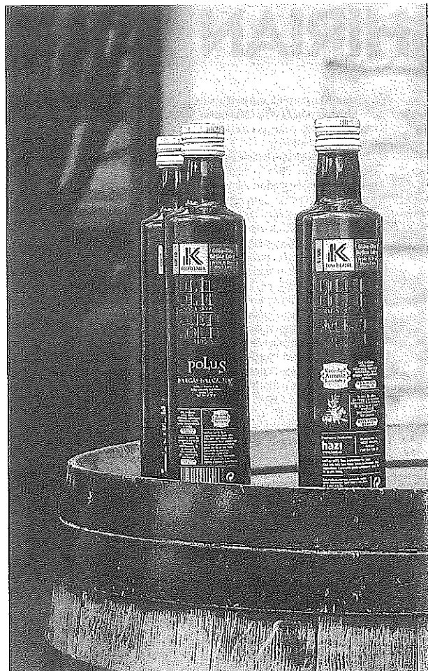
Varias botellas de aceite de oliva de Rioja Alavesa sobre una barrica.

En la actualidad existen cinco trujales trabajando en Rioja Alavesa: el