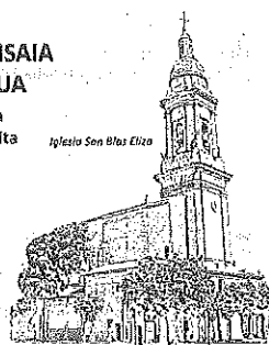
Iglesia San Blas Eliza

Erreserbak / Reservas ARABAKO LAUTADAKO TURISMO BULEGOA OFICINA DE TURISMO DE LA LLANADA ALAVESA 945 30 29 31 turismo@arabakolautada.eis www.arabako lautada.eis