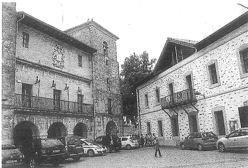
Ayuntamiento de Ayala en la localidad de Respaldiza.