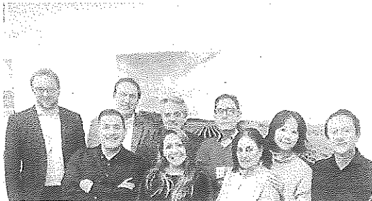
Representantes de la bodega La Rioja Alta, S.A. L.R.

M.C. La Rioja Alta, S.A. recibió el galardón en la categoría de 'Mejor Labor Exportadora' en los XIII Premios de 'Mercados del Vino', de la publicación 'Mercados del Vino y la Distribución'.