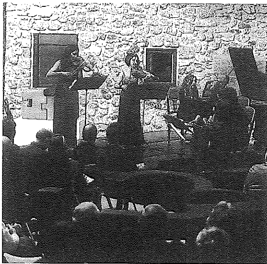
Ensemble Diatessaron en una actuación en Hernani.