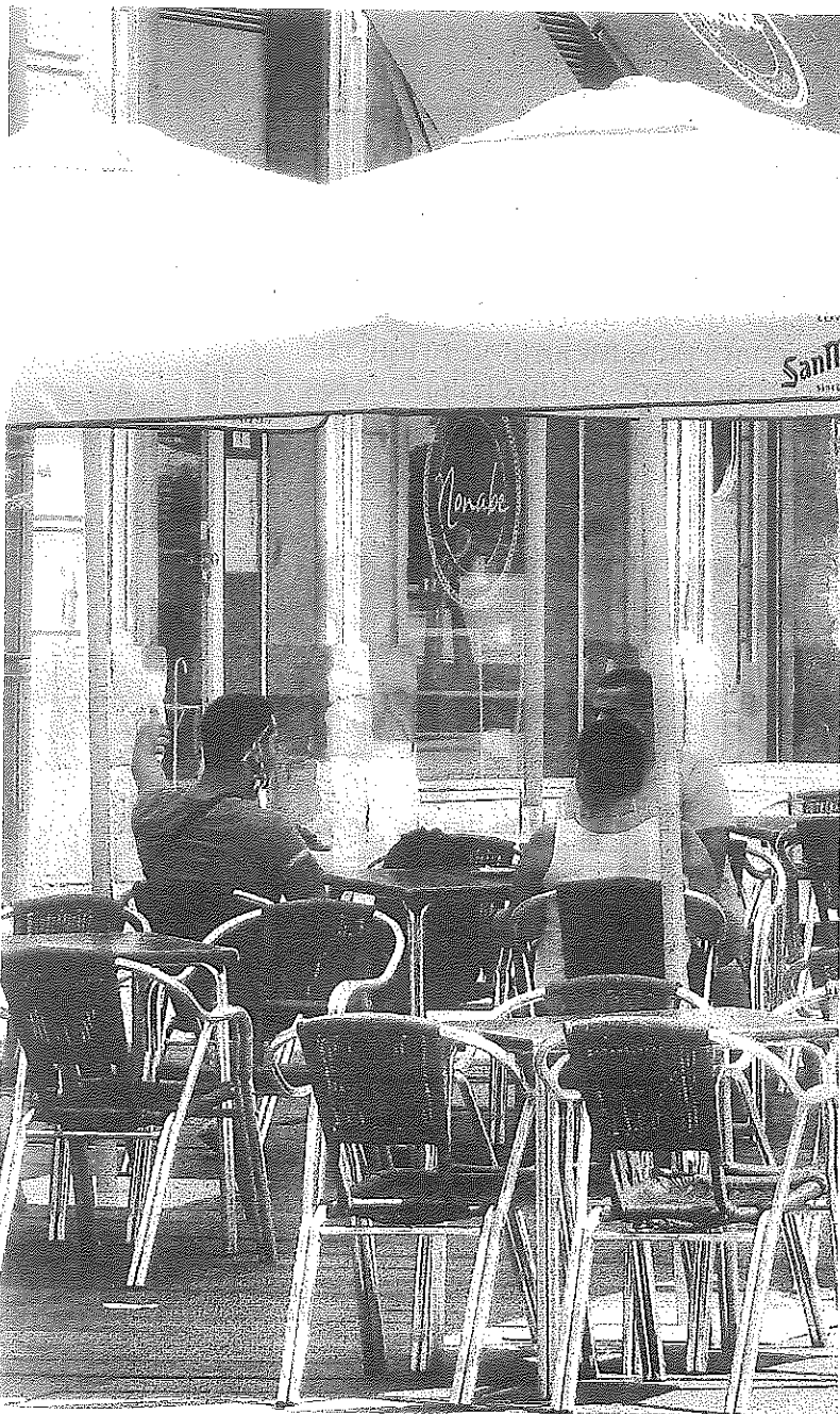
Clientes en la terraza de un bar.