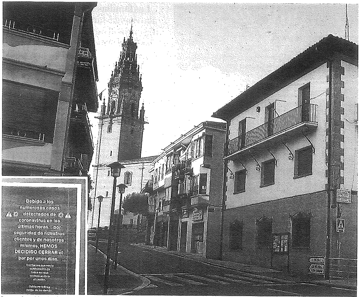
Imagen de archivo de Oion; en la imagen inferior, cartel avisando de un cierre preventivo.

En cualquier caso, se insiste en la necesidad de no bajar la guardia y seguir cumpliendo con todas las medidas sanitarias e higiénicas, como mantener la distancia de seguridad, el lavado frecuente de manos y el uso obligatorio de mascarilla. "Igual que en los momentos más duros del confinamiento, la ciudadanía de Zuia mostró una conducta ejemplar y logró contener la epidemia, ahora debemos seguir cuidándonos y cumpliendo las normas", señala este llamamiento hecho desde el Consistorio de Zuia. La situación de este centro de salud se repite este mes en otros ambulatorios del territorio puesto que al personal médico le han pedido que coja vacaciones ahora para que la plantilla no se resienta de cara al otoño. -R.P.P.