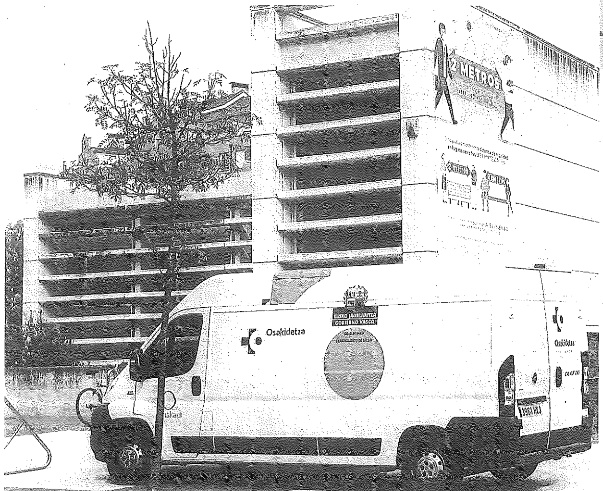
Una ambulancia de Osakidetza, aparcada junto a un centro de salud de la capital alavesa.

ORIGEN MARBELLA Por otra parte, la consejera de Salud adelantó que Osakidetza ha contactado con Andalucía por un posible brote con origen en Marbella. Al parecer, este contacto se produce a raíz de que varios ciudadanos vascos que asistieron en Marbella a una velada de boxeo —un combate disputado en el Marbella Arena— el pasado día 8 hayan dado positivo en covid-19. —Efe